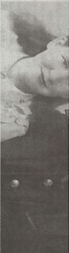
1952 год. Молодые.