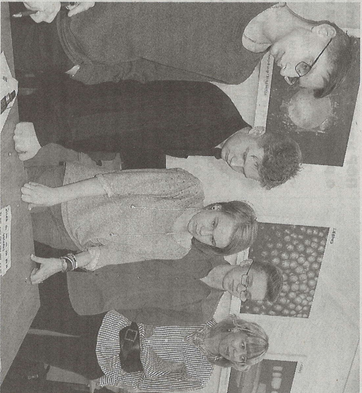
Участники проекта на станции «Общее машиностроение».

школьники прошли образовательный маршрут, на котором познакомились с технологиями специально.